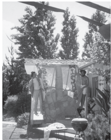
Mit dem »SWAB JOB«-Laken, das sie vom Balkon der Schule herunterließen, als die Abschlussklasse vorbeimarschierte (zusammen mit Allen Baum)