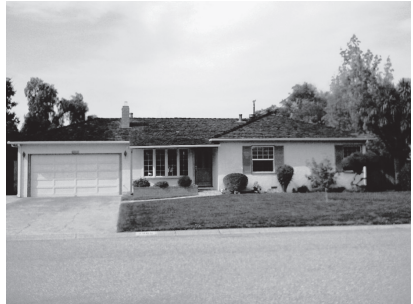
Das Haus in Sunnyvale mit der Garage, in der Apple geboren wurde