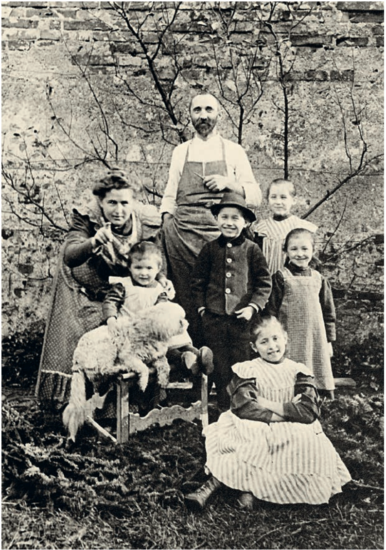
Die Gründerfamilie der Hipp-Baby-Kost, Familie Hipp um 1908