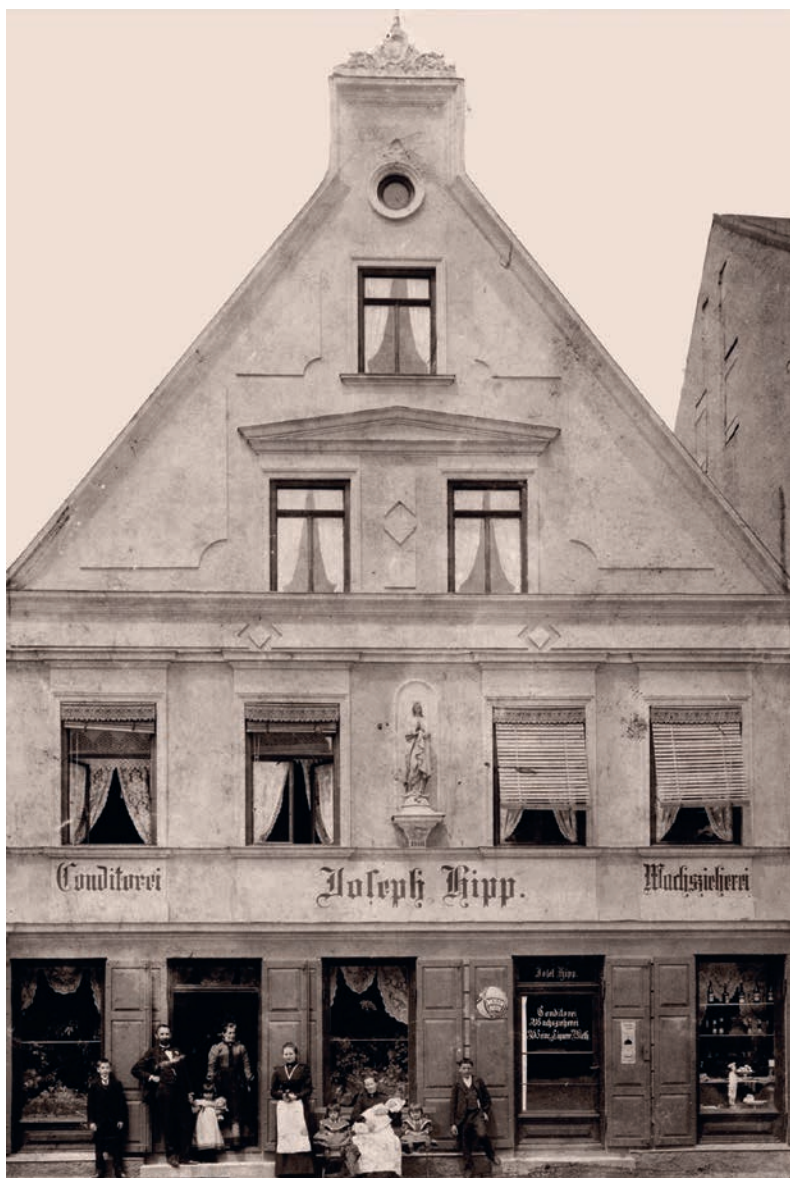
Lebzelterhaus um 1910