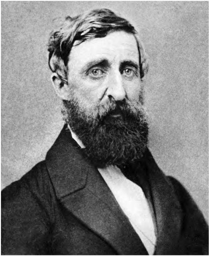
Thoreau 1861 (Edward S. Dunshee)