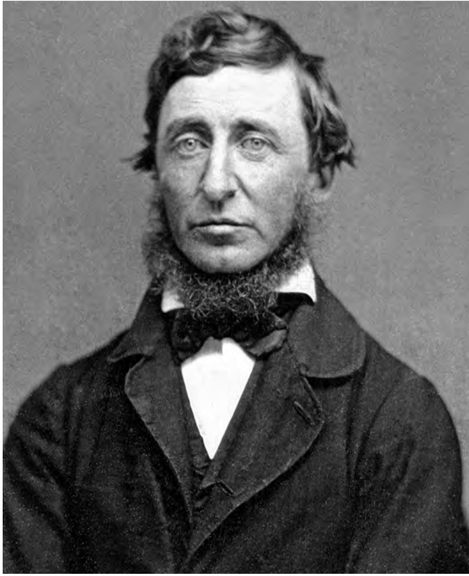
Thoreau 1856 (Benjamin D. Maxham)