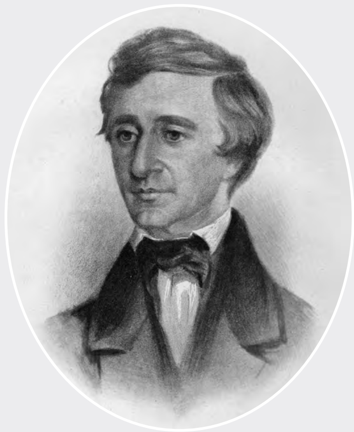
Thoreau 1854 (Samuel Worcester Rowse)