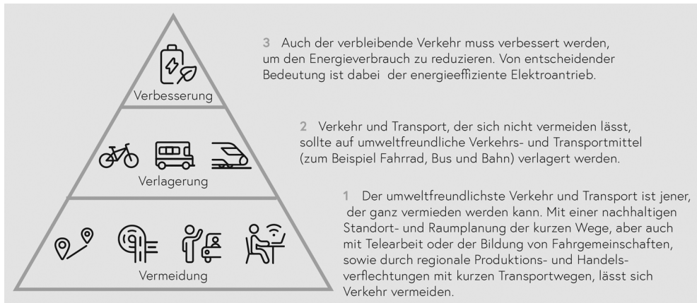
Abb 3: Pyramide nachhaltiger Mobilität [Bundesministerium für Klimaschutz, Umwelt, Energie, Mobilität, Innovation und Technologie, Mobilitätsmasterplan 2030 für Österreich, 2021]

Die Bedeutung der Verkehrsverlagerung wird so umso größer und findet sich zumindest teilweise in einem weiteren Strategiedokument der Europäischen Kommission , der „Smart and Sustainable Mobility Strategy“ aus dem Jahr 2020. 30 Diese Strategie definiert unter anderem die Ziele einer Verdoppelung des Hochgeschwindigkeitsverkehrs auf der Schiene und des Ausbaus der Fahrradinfrastruktur bis 2030 oder einer Verdoppelung des Schienengüterverkehrs bis 2050. Entsprechende Maßnahmen zur Erreichung dieser Ziele müssen erst gesetzt werden.