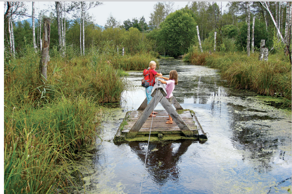
Aus eigener Kraft über den Mooree.

nun schnurgerade Richtung Loisach. Wir passieren eine Vogelbeobachtungsstation und nun sind es noch etwa 500 m bis zum Eingang des Moorpfades . Wenn wir auf der rechten Wegseite eine kleine Holzbohlenbrücke entdecken, überqueren wir diese und wissen nun, dass wir richtig sind. Das bestätigt uns auch sogleich ein etwas verstecktes, vom Weg aus schlecht zu sehendes Schild. Wer möchte, packt nun seine Schuhe in den Rucksack und kann sogleich herrlich weichen Moorboden unter seinen Fußsohlen fühlen, bevor uns der Erlebnispfad erst über einzelne Baumstämme und später über einen Knüppelweg mitten ins Moor führt. Barfußläufer müssen hier auf Nägel in den Bohlen und an einigen Stellen auf Brennesseln achten, die sich je nach Jahreszeit mal mehr, mal weniger stark durch die Zwischenräume der Holzbohlen kämpfen wollen. Vor allem kleinere Kinder sollte man anhalten, langsam zu gehen, und stellenweise an die Hand nehmen, da sich unmittelbar neben dem »Weg« teilweise tiefe Moorlöcher befinden und die Geländer stellenweise wackelig sind. Bald gelangen wir an einen lang gezogenen Tümpel , über den wir uns mit eigener Muskelkraft auf einem Floß ans andere Ufer ziehen können. Die einzig-