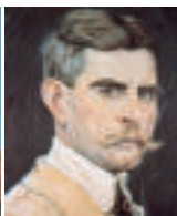
▲ Selbstbildnis (Detail), 1918 (Aquarell-Pastell auf Pappe, Märkisches Museum Berlin)

◀ Im Atelierturm, der zu einer 1925 von Heinrich Lassen erbauten Wohnsiedlung gehört, arbeitete Baluschek von 1929 bis 1933