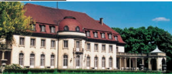
▼ Wohnsitz der Unternehmerfamilie von 1913 bis 1937 – Aufnahme der Gartenseite