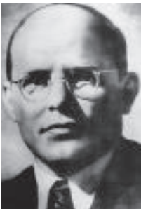
◀ Dietrich Bonhoeffer