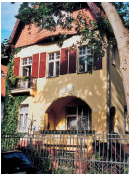
▶ Bonhoeffers Elternhaus