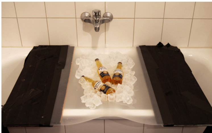
Das Setup für die Aufnahme besteht aus einer dünnen Plexiglasplatte über der Wanne, einem Blitz von unten sowie vielen Eiswürfeln. Hier sehen Sie den Aufbau unter Raumlicht.