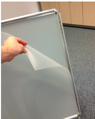
Die dünne Acrylplatte, die den Untergrund für das Durchlicht-Setup bildet, habe ich von einem Plakatständer ausgeliehen.

Am Blitz ist die Streuscheibe ausgezogen und der Kopf schräg nach oben gerichtet. Er durchstrahlt eine Acrylglasplatte von einem Plakatständer, auf der das Eis, die Zitronenscheiben und die Flaschen arrangiert sind. Dadurch, dass der Blitz von der Seite strahlt, vermeidet man einen Hotspot.